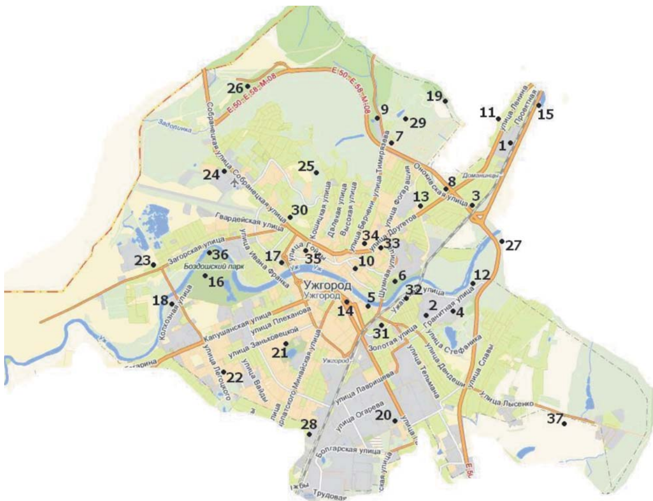
Рис. 1. Точки відбору проб у місті Ужгород