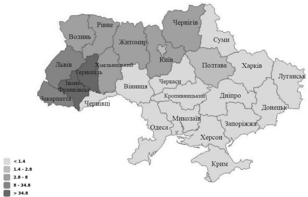
Рис. 1. Географія вступників на ІЕІ