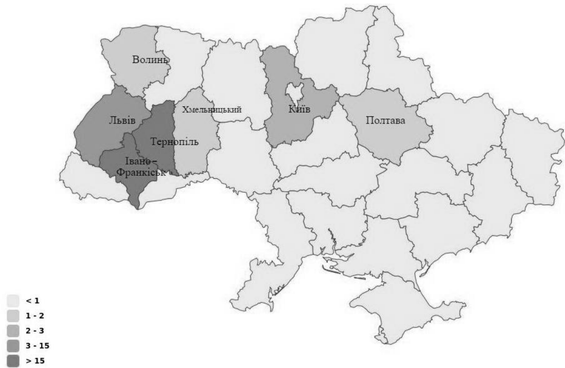
Рис. 2. Географія абітурієнтів, котрі поступили на ІЕІ після закінчення коледжів