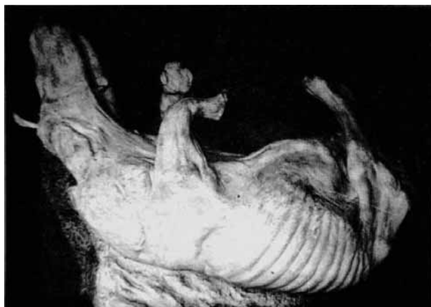
Рис. 1. Гіпсовий відбиток носорога у позиції його залягання у відкладах