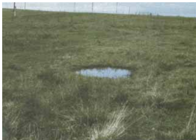
Рис. 2. Кратер грязьового вулкану