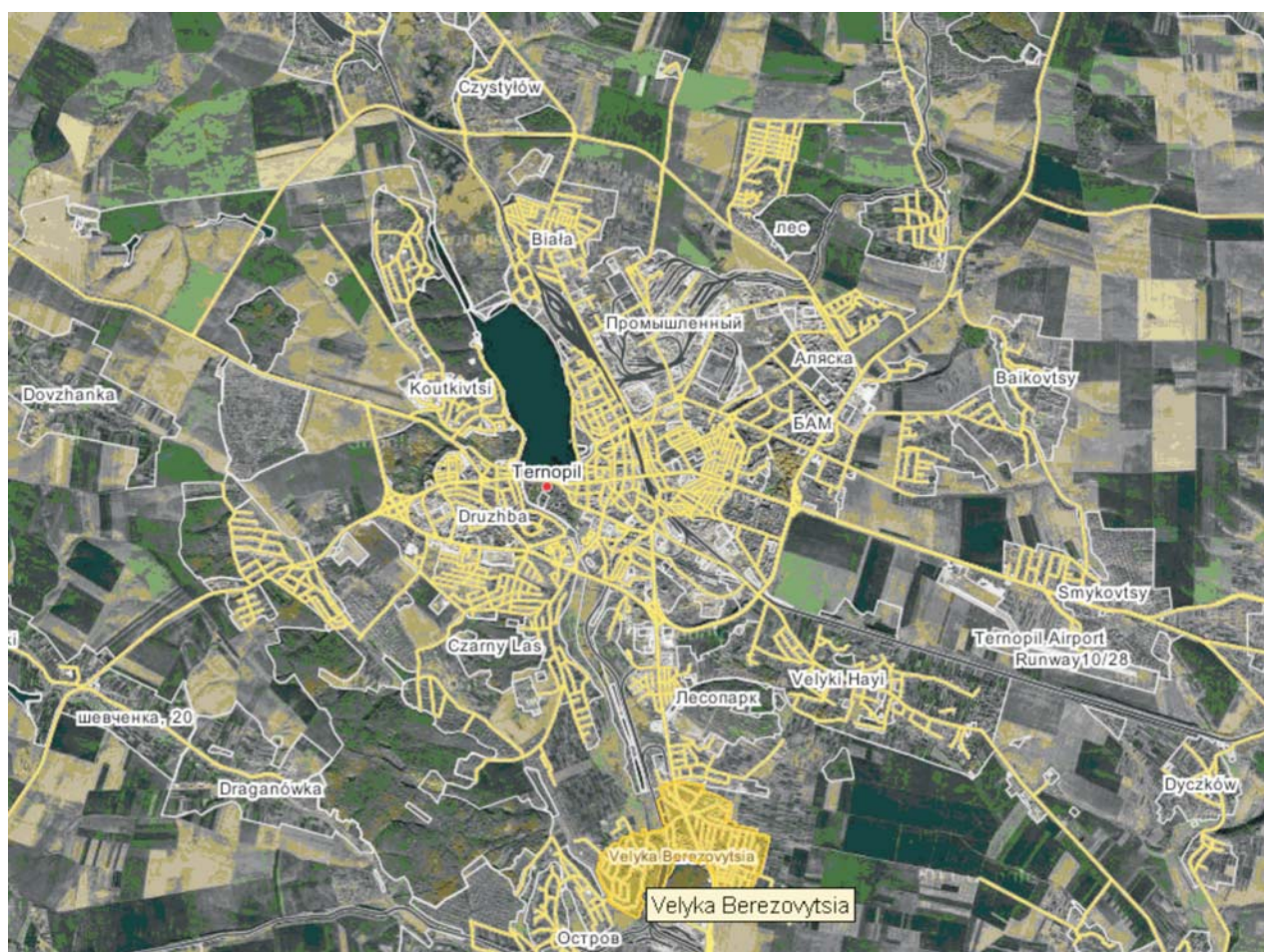
Рис. 2. Космічний знімок м. Тернопіль з супутника LANDSAT 7

Якісна та кількісна оцінка за аерофотокосмомозображеннями морфологічної структури прилеглих до населених пунктів територій допомагає виявити головні вектори перспективної забудови. Наприклад, для міста Львова – це південний і південно-східний вектори житлової забудови на хвилясто-пластових поверхнях із придатними з інженерно-геоморфологічного погляду територіями. Для Рівного перспективним є східний напрям забудови з локалізацією на западинно-хвилястих поверхнях, для Тернополя – північно-східний на хвилястих поверхнях плато (рис. 2).